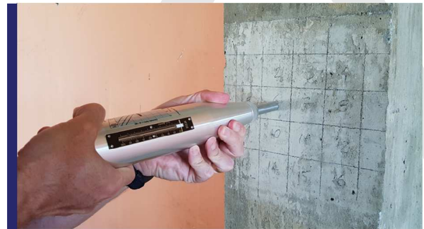
esclerometria (dureza superficial)